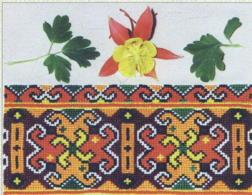
392. Серветка, вишита взором «кучерявим» з квіткою водолійки. Село Космач. (Фото 1998 р.).