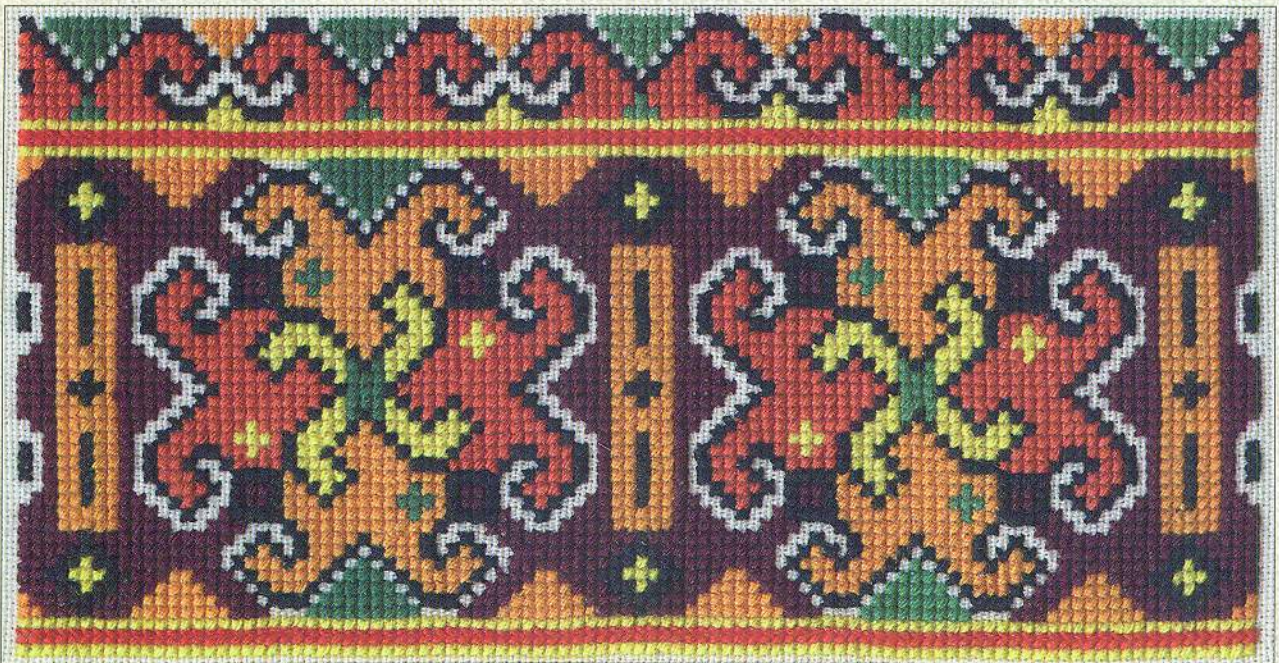
Таблиця 85 б