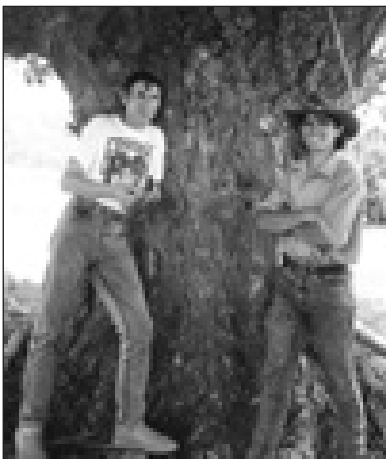
Зустріч аборигенів. Саме на землі цього корінного землевласника — давно пусті «дірки» золотошукачів. Австралія, 19.12.1990 р.