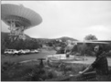
Австралія, Тітбінбілля, ст. НАСА, 19.12.1990 р.