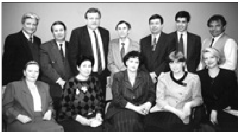
В українському консуляті у Торонто (Канада). 1 квітня 1996 р.