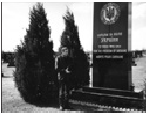
Український культурний комплекс ім. Святого Володимира. Канада, Палермо, 27.03.1996 р.