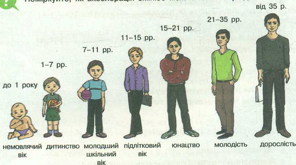
Мал. 1. Вікові періоди

Поміркуйте, як акселерація змінює межі вікових періодів.