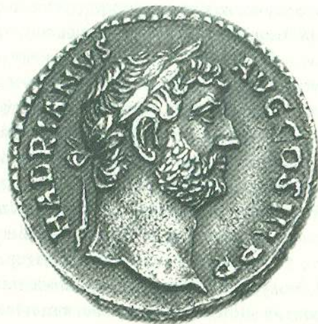
Адріан і його розкішна борода. Classical Numismatic Group Inc. (cngcoins.com)

чоловічої сили. А ще підкреслювали статус: поважний пан мусив бути доглянутий і гладенький, на відміну від замурзаного й патлатого злидаря. Борода вказувала на емоційний стан власника: чоловіки в жалобі (а також ті, хто хотів викликати жалощі в суді) не стригли волосся на обличчі. Зрештою, борода засвідчувала, це римлянин, грек чи варвар 8 .