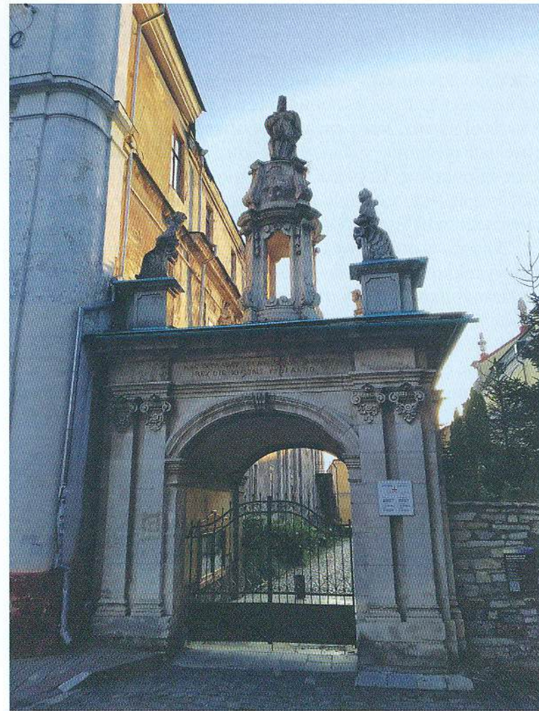
5. Триумфальна арка на честь візиту короля Станіслава Августа Понятовського до Кам'янця в 1781 р. Кам'янець-Подільський, 2021 р.

моєї кандидатської дисертації будуть королівські та великокнязівські документи на землю на території Західного Поділля й Подільського воєводства в XV ст. Саме від того часу я став читати й вивчати біографії володарів, що правили