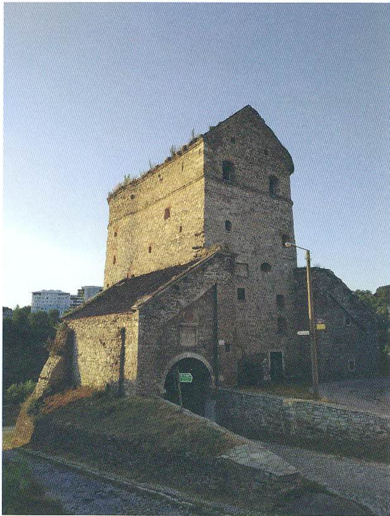
4. Вежа Стефана Баторія. Кам'янець-Подільський, 2021 р.

моєї кандидатської дисертації будуть королівські та великокнязівські документи на землю на території Західного Поділля й Подільського воєводства в XV ст. Саме від того часу я став читати й вивчати біографії володарів, що правили