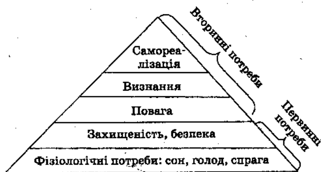
Рис. 1. Ієрархія потреб за Маслоу

В економічній літературі найчастіше використовують класифікацію потреб за ступенем їх задоволення, більш відому як ієрархія потреб за Маслоу (піраміда Маслоу), що передбачає поділ потреб на первинні (фізіологічні) та вторинні. До фізіологічних належать потреби в сні, їжі, утамуванні спраги, захищеності. До вторинних — потреба в повазі, визнанні, самореалізації тощо (див. рис. 1).