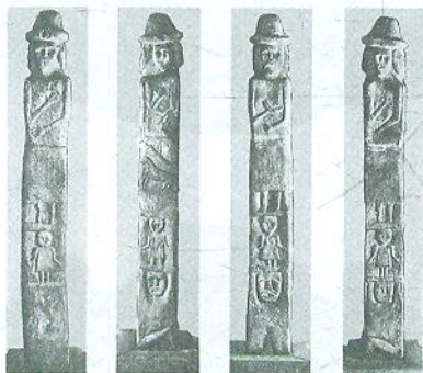
Збруцький ідол. IX ст.

Античний і візантійський поліс (місто-держава) на території сучасного Севастополя, що увійшов до списку світової спадщини ЮНЕСКО. Місто, назва якого перекладається як «півострів», засновано колоністами з Гераклеї Понтійської. На Русі відомий як Корсунь, де 988 р. хрестився князь Володимир.