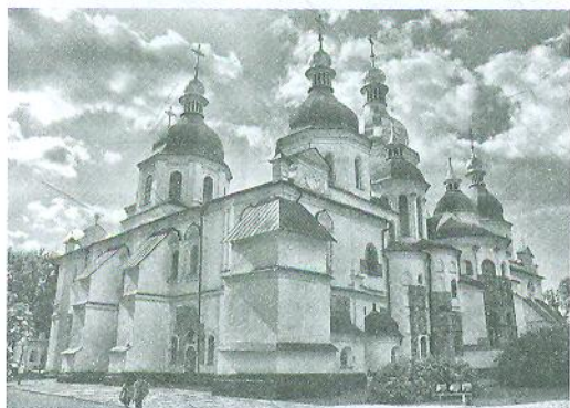
Софійський собор у Києві. Перша половина XI ст.

Зведений за часів Ярослава Мудрого як кафедральний собор, був резиденцією православних і греко-католицьких митрополитів.