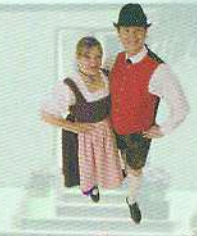
Австрійський народний костюм