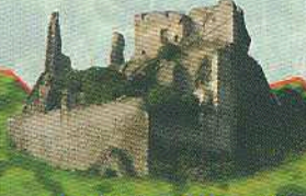
Руїни фортеці Дюрнштейн