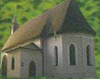
Церква Святого Мартіна. Лінц