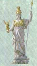
Віденська Афіна Паллада