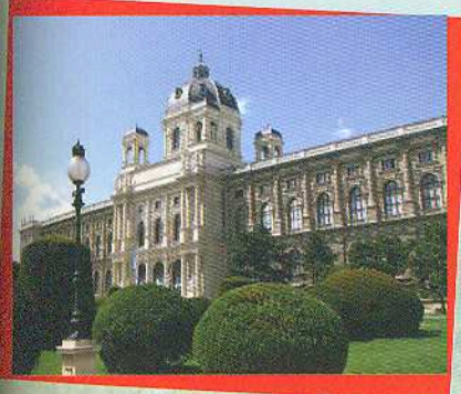
Музей природознавства. Відень