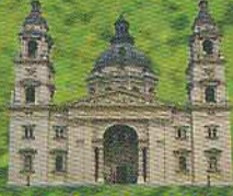
Собор Святого Стефана. Відень