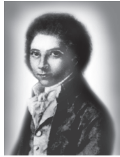
▲ Август Вільгельм Шлегель.

В естетиці єнських романтиків, зокрема їхнього провідного теоретика Ф. Шлегеля , маємо проекцію фіхтевського “я” на митця, що неминуче, в силу специфіки мистецтва як виду духовно-практичної діяльності людини, вело до зближення “я” (= духу) з “я” митця. “Якого типу філософія випадає на долю поета? — запитував Ф. Шлегель. — Це — творча філософія, що виходить з ідеї свободи та віри в неї і показує, що людський дух диктує свої