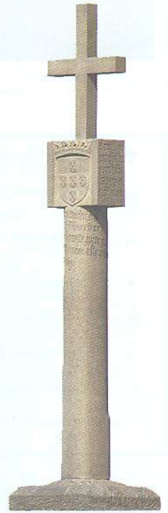
Падран — стовп із королівським гербом (сучасна копія). Такі стовпи португальські мореплавці встановлювали на відкритих ними берегах