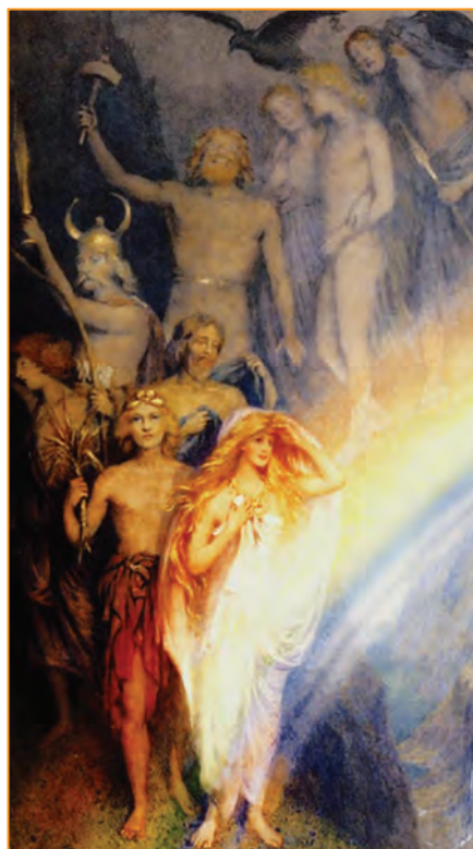
В. Колінгвуд. «Зішестя північних богів у Мідгард»