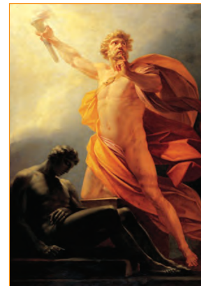
Г. Фюгер. «Прометей»

Розглянь представлені репродукції та визнач, яка з них створена на сюжет міфу Стародавньої Греції.