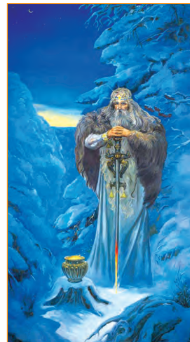
А. Клименко. «Прабатько Сварог»