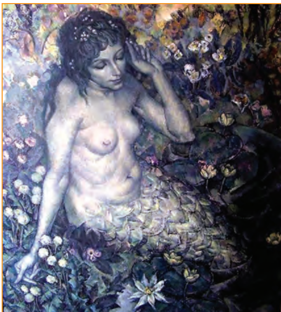
Р. Жигачов. «Русалка. Вода та квіти»