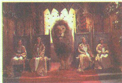
Кадр із кінофільму «Хроніки Нарнії: Лев, чаклунка і шафа», (режисер Е. Адамс, 2005 р.)

У цьому описі ми відчуваємо все, що притаманне Аслану як шляхетному захиснику, мудрому