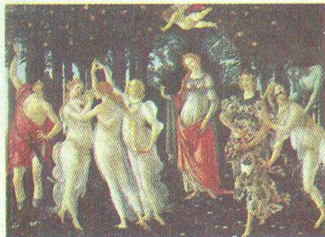
С. Боттічеллі. Весна. 1482 р.

Поряд з індивідуальними авторськими образами існують так звані традиційні образи . Це – образи, які повторюються і варіюються у творах різних митців. Вони є в кожній національній культурі. Наприклад, в українській культурі традиційним є образ калини, звичний для народних пісень, казок, орнаментів, літературних і малярських творів. Він вважається своєрідним символом 1 України.