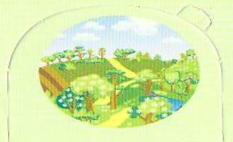
ВЕСНА — ОСІНЬ