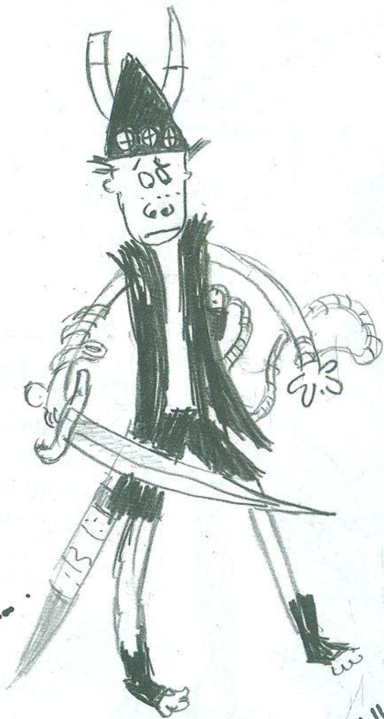
ГИККУС СТРАХІТНИЙ ОКУНЬ ТРЕТІЙ І ЙОГО МЕЧ ЗУХВАЛЕЦЬ