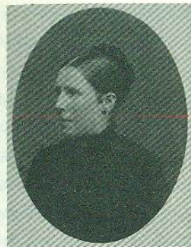
Справа: Віллеміна Якоба (Віллемін) ван Гог Вінсент ван Гог, 1881 р. Олівець і штрихи вугілля, папір верже 41,4 × 26,8 см

Вінсент і Віллемін були інакшими — не такими, як їхні сестри Анна й Ліз і брати Тео й Корнеліус (Кор) — і вирізнялися неприйняттям панівних норм суспільства. Ця схожість проявлялася ще з дитячих років. Обоє мали складнощі в школі й глибоко цікавилися релігією, мистецтвом і літературою. Вони ніколи не брали шлюбів, не заводили дітей і мали проблеми з психічним здоров'ям, які відкрито обговорювали між собою. Імовірно, Віллемін із часом зрозуміла, що її сексуальність теж інша 5 . Та насамперед Вінсент і Віл боролися за надто прогресивні для свого часу ідеї та відмовлялися відповідати очікуванням усіх навколо. Па й Ма були залучені в суспільне