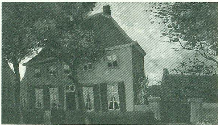
Пасторат у Нюнені Вінсент ван Гог, 1885 р. Олія, полотно 33,2 × 43 см

30 березня 1885 року протестантського пастора поховали на Томаккерському місцевому цвинтарі біля підніжжя старої Нюненської вежі. Навіть на відстані за нею легко було зорієнтуватися, де розміщене місце поховання, а ще його було видно із саду будинку преподобного. У березні 1884 року Вінсент зробив начерк цього краєвиду олівцем, ручкою і чорнилом (див. іл. III). У листі до свого колеги й друга Антона ван Раппарда він описав жінку в центрі композиції радше як примару у формі чорнильної плями, аніж правдиве зображення людського тіла 3 . День, на який припав похорон Доруса, 30 березня, мав вагоме значення для родини. Він збігався не лише з днем народження Вінсента в 1853 році, а й із датою, коли 1852 року мертвонародженим з'явився первісток сім'ї, теж Вінсент.