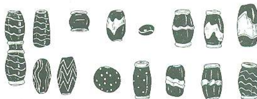
Різновиди оздоблення давньоруських скляних намистин

Значно рідше вітчизняні склярі виготовляли декоровані намистини, для яких використовували зазвичай двошхтове скло. Матриці робили, навиваючи розігріту скляну паличку на металевий стержень, потім розплавленою скляною ниткою іншого кольору на матрицю накладали рельєфний візерунок, а насамкінець краї намистин оздоблювали обідками (в деяких кораликах обідків немає).