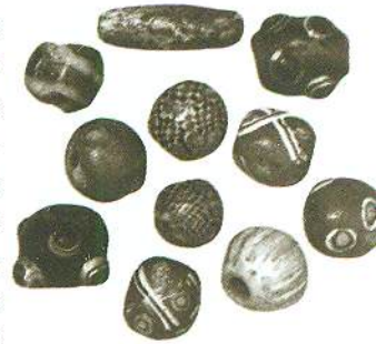
СКЛЯНІ НАМИСТИНИ, орнаментовані «очками» та мозаїчним узором. V — I ст. до н. е., с. Золоте АР Крим. Публікується за: ІУК: У 5-ти т. — К., 2001. — Т. 1. — С. 423

Найулюбленішим штучним матеріалом для виготовлення намистин стало скло. Деякі вчені вважають, що його технологію було винайдено внаслідок тривалого експериментування зі складниками керамічної сировини та температурними режимами її випалу. Спочатку таким чином отримали фаянс, а згодом і саме скло. Технологія скла в різних місцевостях мала свої істотні відмінності, тому за хімічним