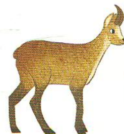
сарна chamois [шамуа]