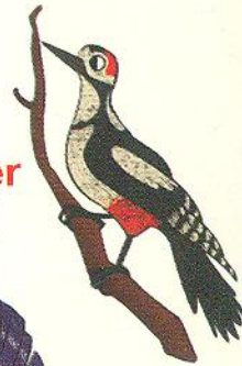
дятел woodpecker [вудпеке]