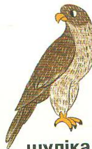
шуліка kite [кайт]