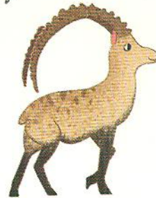
гірський козел mountain goat [маунтін гоут]