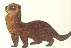
тхір polecat [поулкет]