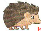
їжак hedgehog [хеджжог]