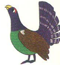
глухар sapercaille [капекейлі]