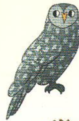
сова owl [аул]