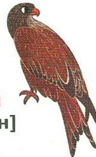
сокіл falcon [фолкен]