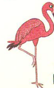
фламініго flamingo [флемінгоу]