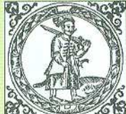
ГЕРБ УКРАЇНСЬКОЇ КОЗАЦЬКОЇ ДЕРЖАВИ