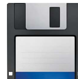
Гнучкий диск (дискета)