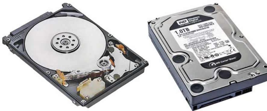
Жорсткий диск (вінчестер)