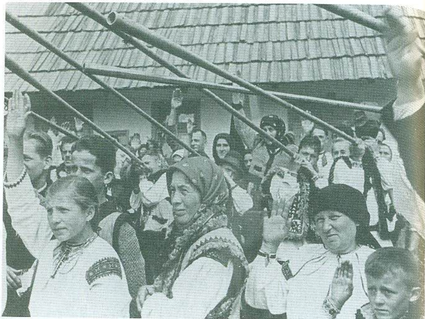
Прощання добровольців в селі Жаб'є на Гуцульщині (фрагмент)