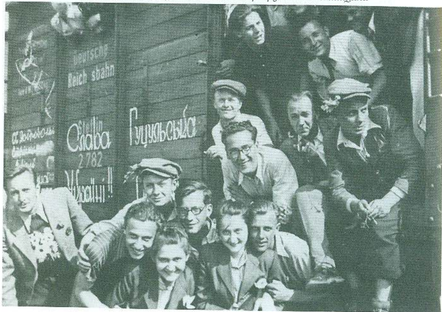
Від'їзд добровольців 18 липня 1943 р. Група з Коломийщини