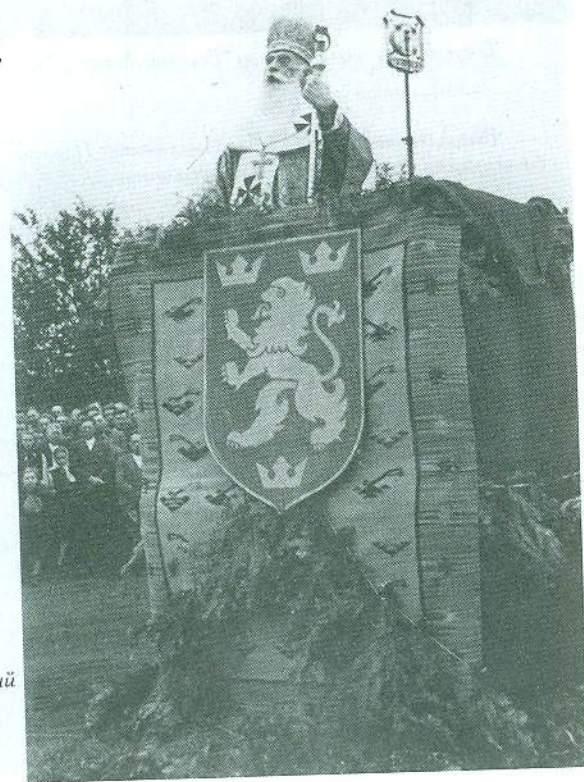
Єпископ Йосафат Коциловський говорить прощальне слово добровольцям у Перемислі, липень 1943 р.