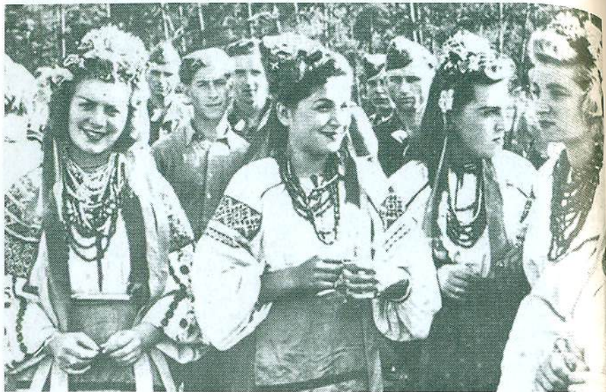
Танцювальна група театру "Веселий Львів" у "Гайделягері", 29 серпня 1943 р.