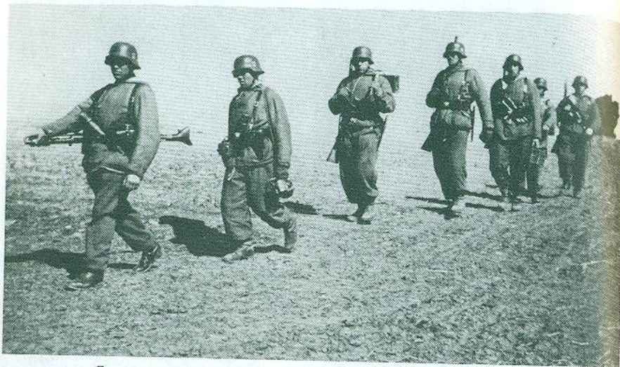
Свержа над Бугом, березень 1944 р. Вояки Дивізії в боях проти большевицьких партизанів (бойова група "Баерсдорф"). Рій іде на розвідку