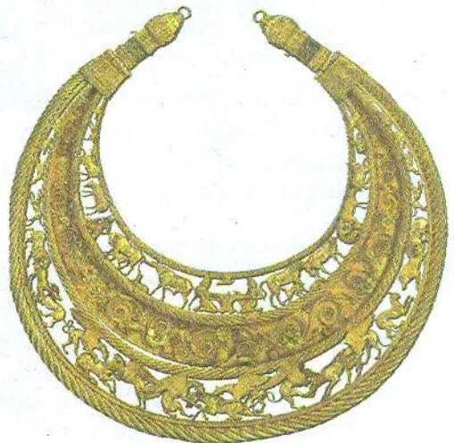
Пектораль із кургану Товста Могила Дніпропетровська обл.

У той час, коли в степах жили скіфи, у зручних для мореплавства місцях Північного Причорномор'я поселилися давні греки. Вони створили тут міста-держави (поліси), які торгували з місцевим населенням. Отже, землі сучасної України були поєднані з давньогрецькою, а згодом — з греко-римською цивілізацією.