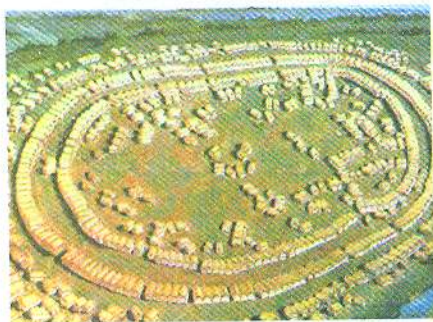
Поселення трипільців. Реконструкція

Перші землероби та скотарі з'явилися на території України в епоху неоліту в межах річки Південного Бугу й Дністра, тоді ж як і на інших землях Центрально-Східної Європи. Землеробство й тваринництво забезпечували людей продуктами харчування надійніше, ніж полювання та збиральництво. Кількість населення знову зростає, і використання недосконалих кам'яних, кістяних і дерев'яних знарядь праці вже не задовольняло вимог виробництва. Люди знайшли надійніший матеріал — мідь, яка трапляється в природі у вигляді самородків.