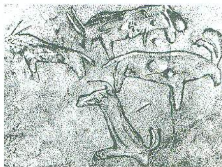
Найдавніші петрогліфи на теренах України.

Знаряддя праці, залишені на землях сучасної України, подібні до знахідок із стоянок у Німеччині, Польщі та Словаччині. Тобто із самого початку історії територія України розвивалась як складова частина Європи.