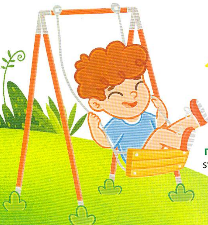
го́йдалка swing [сві́н]

Розкажи, що є на твоєму дитячому майданчику. Чим тобі найбільше подобається там займатися?