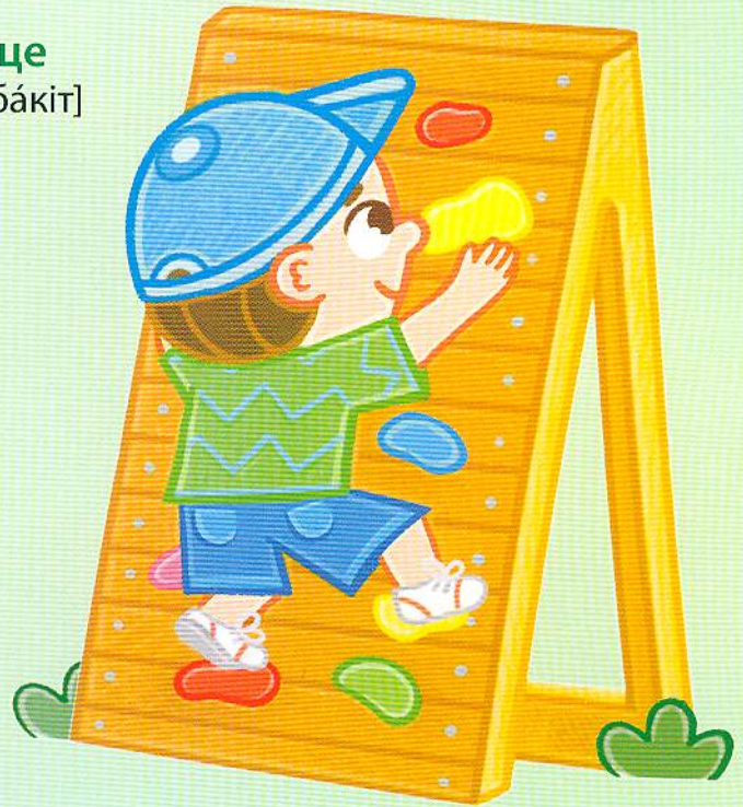
вiдeрцe bucket [бáкiт]