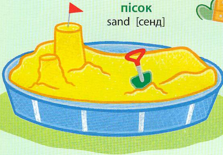
пiсoк sand [сeнд]