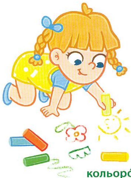
кольоро́ва кре́йда coloured chalk [ка́лед чо:к]