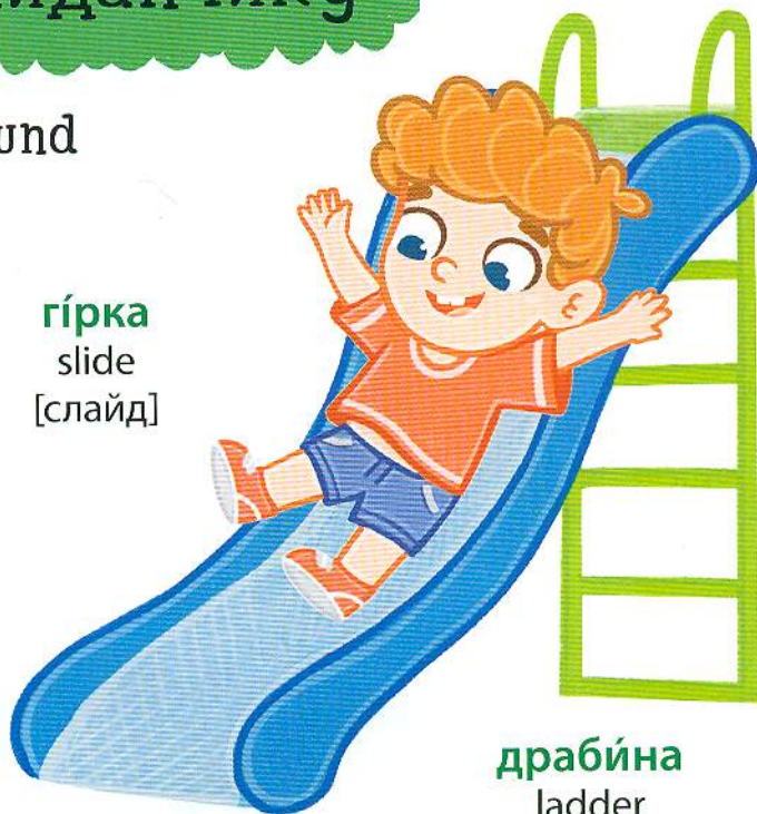
гірка slide [слайд]