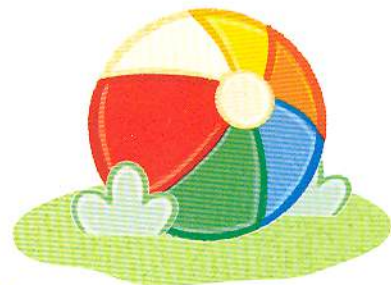
м'яч ball [бо:л]