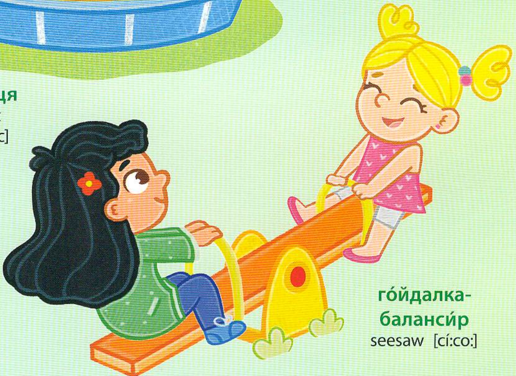
гóйдалка- балансiр seesaw [сi:co:]