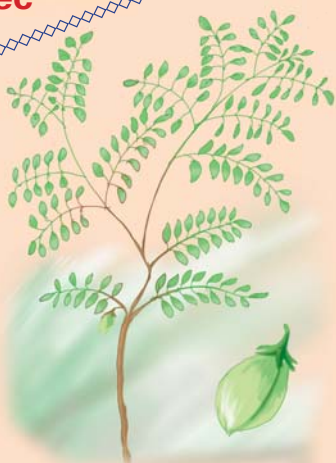
Нут (баранячий горох)