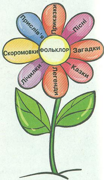
Схема «Квітка фольклору»

Свої спостереження, думки, почуття і мрії давні люди відображали в різних творах. Так почали своє життя прислів'я, приказки, скоромовки, приповідки, дражнилки, лічилки, загадки, пісні, казки, легенди.