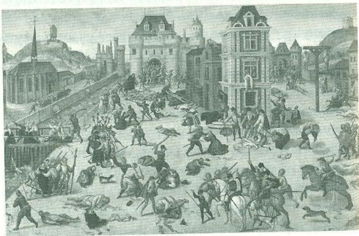
Різанина у Варфоломівську ніч. Картина Франсуа Дюбуа, 1862 рік. Кантональний музей мистецтв у Лозанні, Швейцарія

Весілля відзначали пишню. У палаці на острові Сіте на мармуровому столі було сервіровано вечерю для придворних, «міських магістратів, парламенту, рахункової та монетної палат», яка завершилася балом. Водночас парижани і приїжджі католицькі вожді та їхній почет уже гострили ножі. До них приєдналися селяни з передмість