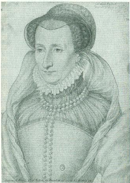
Жанна д'Альбре, королева Наварри. Портрет олівцем Франсуа Клуе, 1560-ті. Національна бібліотека Франції, Париж

Генріх IV, людина неабиякого розуму, не був схожий на своїх сучасників. Дослідники й нині відзначають: цей м'якосердий, толерантний, скептичний уродженець Півдня, сонячної Наварри, як жоден інший тогочасний монарх, зберіг у собі ренесансний оптимізм.