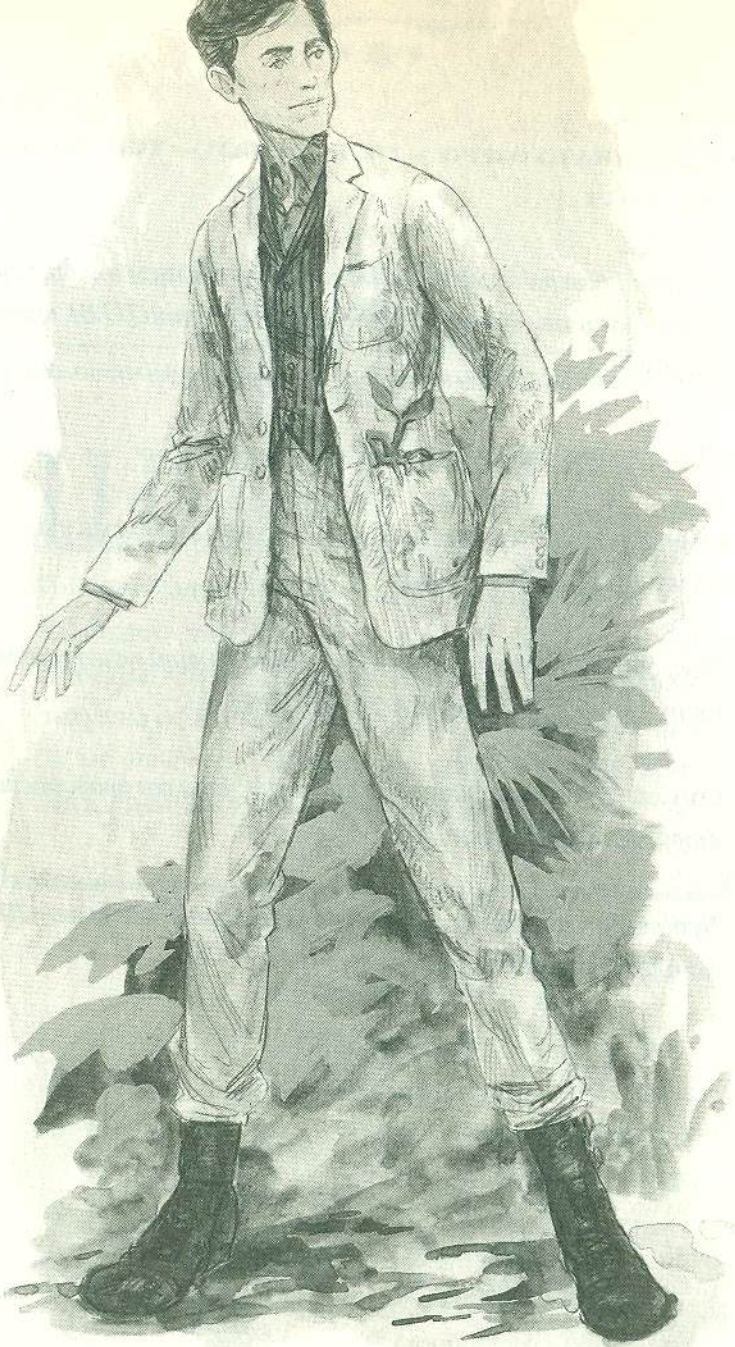
ЕСКІЗИ КОСТЮМА НЬЮТА СКАМАНДЕРА