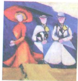
О. Екстер. Три жіночі фігури. 1910 р.