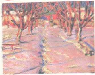
М. Бурачек. Зима. Алея в саду

1 Розглянувши репродукції картин, дайте відповіді на запитання.