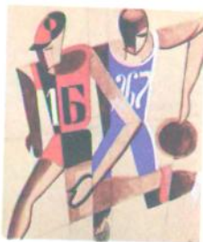
А. Петрицький. Ескіз костюмів до вистави «Футболіст». 1929 р.