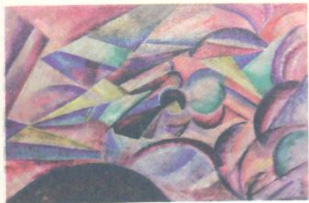
О. Богомазов. Космос. 1910 р.