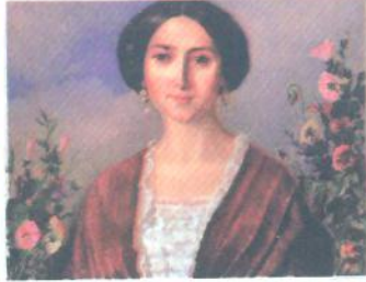
А. Мокрицький. Портрет дружини