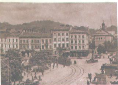
Львів. Початок ХХ ст. Фото

1932 р. урядовою постановою «Про перебування літературно-мистецьких організацій» було зупинено діяльність письменницьких організацій та утворено Спілку радянських