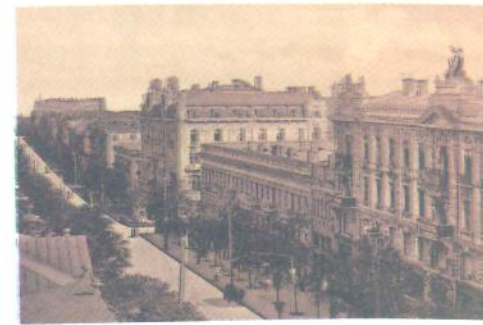
Одеса. Фото. Початок ХХ ст.

Українську літературу 20-х років ХХ ст. називають «червоним ренесансом», або «розстріляним відродженням».