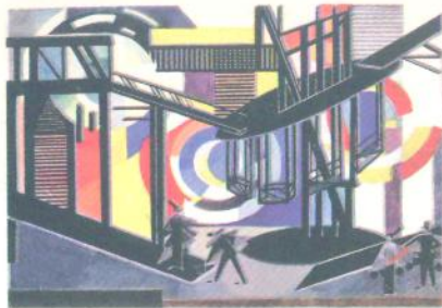
О. Екстер. Театральні декорації. 1924 р.