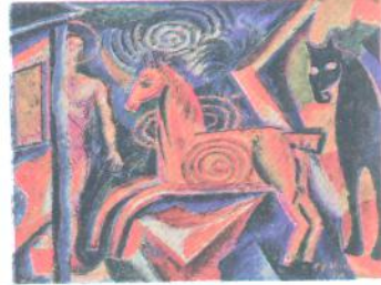
Д. Бурлюк. Карусель