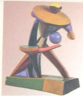
О. Архипенко. Карусель П'єро. 1913 р.

Коли 1914 р. розпочалася Перша світова війна, М. Семенка мобілізували на Далекий Схід, у Владивосток, де він служив телеграфістом. Тут поет написав збірки « П'єро здається » і « П'єро кохає », випробувавши себе в імпресіонізмі й символізмі. Зміна мистецьких настроїв пов'язана з романтичною та водночас сумною любовною історією. Грубий та іронічний поет маскує себе в образі ліричного героя П'єро.