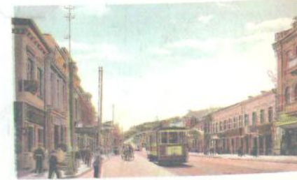
Київ. Фото. Початок ХХ ст.

1923 р. в Києві було створено групу « Аспіс » («Асоціація письменників»), до якої належали митці різних поколінь і світовідчужань: М. Рильський, Є. Плужник, М. Зеров, Г. Косинка, П. Филипович, В. Підмогильний. З «Аспісу» вийшли май-