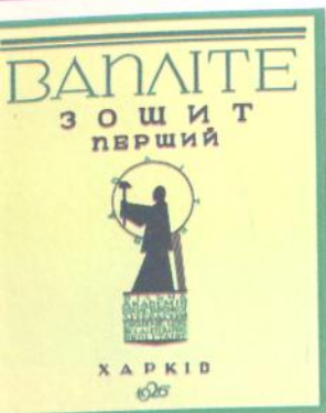
Обкладинка альманаху з логотипом ВАПЛІТЕ. 1926 р.

бутні неокласици. Через рік це угруповання вже було реорганізоване в «Ланку». Воно проголосило об'єднання старої української літератури з новою, оскільки «пролетарська література розривала українські традиції». 1926 р. до «Ланки» приєдналися ще декілька митців — так постало угруповання МАРС (Майстерня революційного слова).