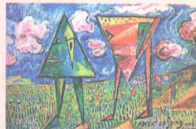
Д. Бурлюк. Прихід весни та літа. 1914 р.

2007 р. на лондонських торгах аукціонного будинку «Sotheby's» було встановлено рекорд: картину Д. Бурлюка продали за $ 650 000.