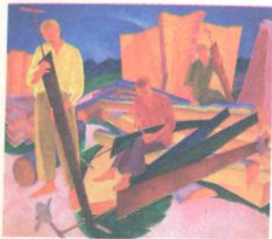
О. Богомазов. Правка пилко. 1926 р.

1 Розгляньте репродукції картин і виконайте завдання.