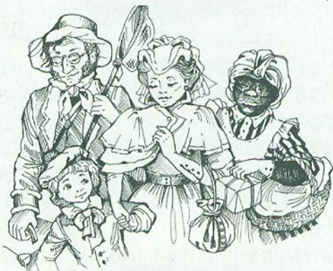
О. Чичик. Ілюстрація до роману «П'ятнадцятирічний капітан»