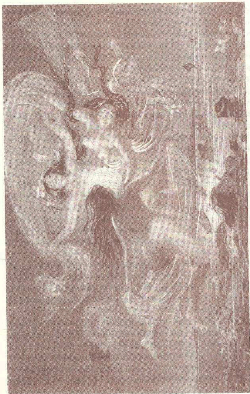
Русалки. Т. Шевченко