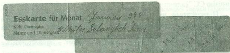
Талон на харчування вояка Івана Зубанича. 15 січня 1944 р.