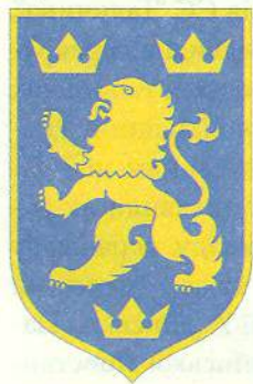
Відзнака галицьких добровольчих полків СС. 1943 р.

через психологічні та політичні причини мобілізованих галичан, які не бажали служити у поліційних частинах, новостворені полки називати “галицькими добровольчими полками СС” – Galizische SS-Freiwilligen Regiment 2 . Попри таку гучну назву, вояки цих підрозділів не були членами організації СС, а вважалися як іноземні добровольці на службі у військах СС. Через значний політичний тиск окупаційної влади вони носили не українські державницькі відзнаки, а спеціально розроблені для них національні знаки, які пов’язували їх з традиціями краю та опиралися на вій-