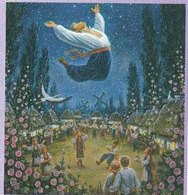
О. Шупляк. Гопак