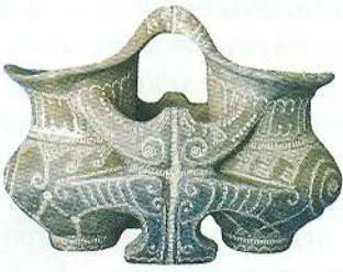
Елементи Дерева життя на трипільському посуді

часи, коли не було ще ні неба, ні землі, а тільки синє море. Посеред моря росло дерево (дуб, явір чи сосна). На ньому три птахи (голуби чи соколи) раду радили, як заснувати світ. Птахи пірнули в море й дістали дари, з яких постав світ: із золотого каменя — сонце, зі срібного — місяць, з піску — зірки, а з мулу — земля.