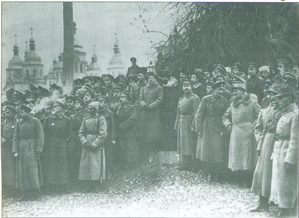
Проголошення III Універсалу Української Центральної Ради 20 листопада 1917 року в Києві на Софіївській площі. У центрі – Симон Петлюра, Михайло Грушевський, Володимир Винниченко – соціалісти-паціфісти.

Українську державу. Майже весь Чорноморський флот також підняв жовто-блакитні знамена. (Про це мова далі). Та соціалісти Грушевський і Винниченко були іншої думки і поглядів.