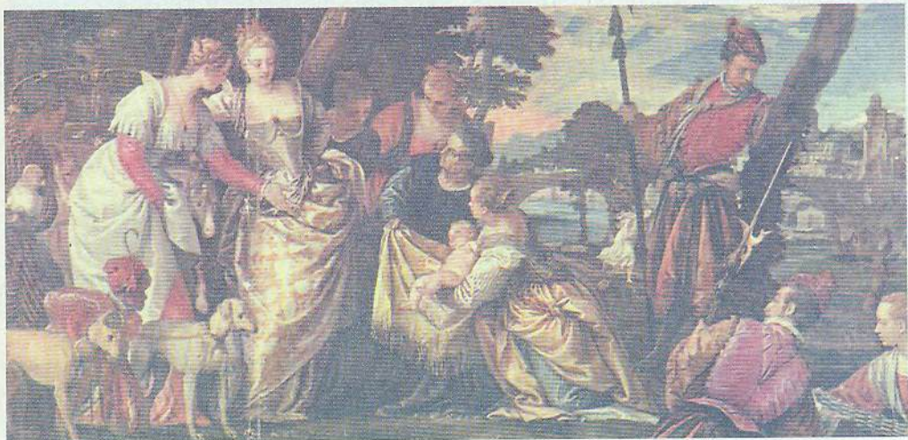
П. Веронезе. Знайдення Мойсея. 1560-ті рр.

Сестра хлопчика, яка спостерігала за цими подіями, запропонувала доньці фараона взяти годувальницею його рідну матір. Так рідна мати отримала можливість вигодувати своє дитя. Коли Мойсей підріс, вона привела його до доньки фараона в палац, де він надалі зростав, оточений увагою і любов'ю, як принц. Там йому дали добру освіту, прищепили «єгипетську мудрість». Проте Мойсей пам'ятав про власне єврейське походження й цікавився життям свого народу. З гарячим співчуттям він спостерігав за стражданнями євреїв у єгипетському рабстві. Одного разу він став на захист свого одноплемінника, якого жорстоко бив єгиптянин, і вбив кривдника. Ховаючись від покарання, Мойсей утік до землі Мадіамської. Там він познайомився зі священником Йофором, одружився з його донькою і прожив сорок років, заробляючи на життя як пастух.