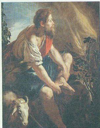
Д. Фетті. Мойсей і Неопалима Купина. 1615–1617 рр.

Одного разу, випасаючи отару неподалік від гори Синай, Мойсей побачив дивний терновий кущ, який палав, але не згорав. Із цього куща, що в Біблії називається Неопалимою Купиною, до нього промовив Бог.