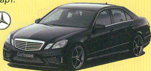
Мерседес-Бенц W212 – автомобіль 4-го покоління Е-класу

АМГ (AMG) – підрозділ компанії, який займається тюнінгом автомобілів Мерседес .