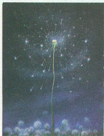
О. Шупляк. Великий вибух

1. Емоційно-естетична 1 функція. Одна з найглибших людських емоцій — відчуття, переживання краси . Усе в Усесвіті (від сніжинки до галактик) твориться та розвивається за законами краси. Митець у своєму творі за допомогою уяви висвітлює прекрасне, передає в різних явищах і подіях. Милуючись красою, людина відчуває радість, щастя, звільняється від егоїстичних турбот.