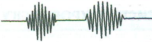
Мал. 1.1. Дихання Чейна—Стокса