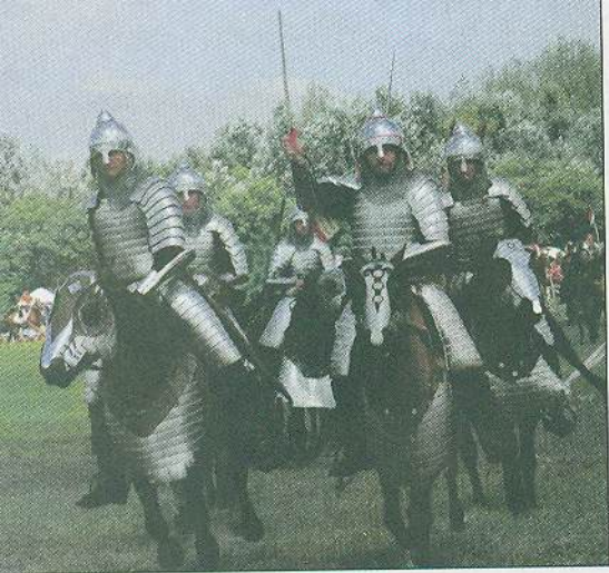
Аварські вершники. Реконструкція