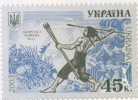
Поштова марка, присвячена боротьбі слов'ян проти аварів. 2003 р.

Авари воювали не так, як інші кочівники. Тіло аварського воїна і його коня вкривали металеві пластини, а голову — глибокий шолом. У бою авари використовували лук і шаблю-палаш. Завдяки стременам вони могли завдати ударів довгим списом. Спочатку авари засипали військо противника стрілами з луків, а кіннота зі списами вривалася в його стрій. Потім ішли в хід удари шаблями.