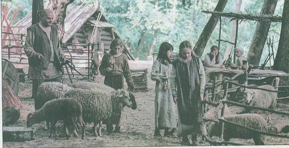
Кадр з українсько-словацького серіалу «Слов'яни», що розповідає про життя слов'ян у VII ст. 2021 р.