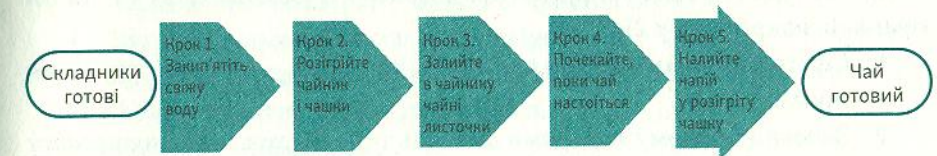
Рисунок 2. Ще процес