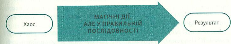
Рисунок 1. Процес

Зазвичай при правильному підході будь-який процес обов'язково представляється графічно, наприклад у спрощеному вигляді.