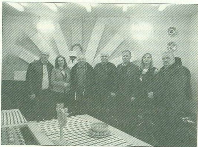
Гості з міста Кимполунг-Молдовенеск (Румунія)

й до логіки обрядової дії — можна читати все. І щоб цей портал розкрився, варто лише бути відкритими до знань. Без обмежень, упередженостей і стереотипів.