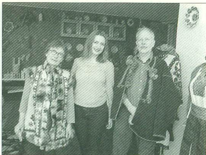
Сімейна пара з Гельсинкі пізнає українські традиції