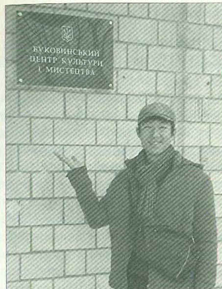
Гість із Південної Кореї