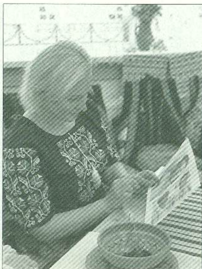
Заняття про вишиті сорочки знаменитостей до Всесвітнього дня вишиванки