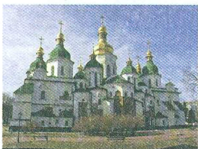
Собор Святої Софії. м. Київ