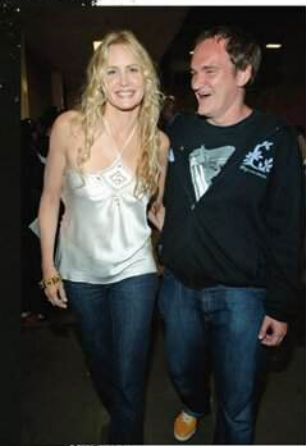
ВГОРІ. З Деріл Ганна, для якої він написав роль Ельз Драйвер з «Убити Білла» (2003)

на сцені та особисто повідомити, що написав під мене роль. Ми не були знайомі. Розказав, що побачив мене в телефільмі, назви якого я навіть не пам'ятала. Я подумала: «Ну звісно, вас знімає прихована камера». Я не знала, вірити чи ні, але через кілька місяців Квентін надіслав сценарій. Неймовірно.