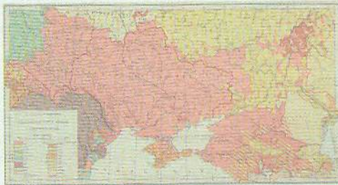
Мал. 14. Етнографічна карта України В. Кубійовича, 1934