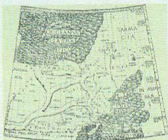
Мал. 11. Перше зображення земель України на карті К. Птолемея на Десятій карті Європейської Сарматії (Болонья, 1477)

З другої половини XIX ст. українські картографи відображали на картах територію розселення українського народу, яка була значно більшою, ніж територія сучасної української держави. Найбільш відомими є карти П. Чубинського («Карта південноруських нарід і говірок», 1871), С. Рудницького («Оглядова карта українських земель», 1918), В. Кубійовича «Етнографічна карта України», 1934, мал. 14).