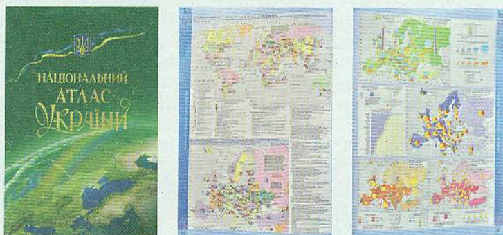
Мал. 16. Національний атлас України (2007 р.)