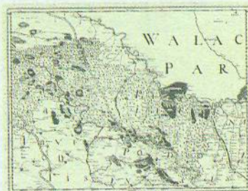
Мал. 12. Карта України Г. де Боплана, секція V (Гданськ, 1650)