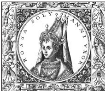
Роксолана. T. de Bri. Vitae Et Icones Sultanorum Turcicorum, Principum Persarum aliorumque illustrium Heroum Heroinarumque ab Osmane usque ad Mahometem II. Ad vivum ex antiquis Metallis effictae, primum ex Constantinopoli D. Imp... Civem Francforti, 1596. – S. 206

серію образів портрет Роксолани невідомого автора, створений масляними фарбами, зберігається у флорентійській галереї Уфіци і є, найімовірніше, авторською інтерпретацією двох попередніх її портретів. Адже зображена на ньому жінка темноволоса і похмура.