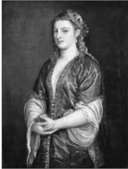
Портрет леді (Роксолани). В. Тиціан. 1555 р. Samuel Kress Collection, Courtesy of the National Gallery of Art, Вашингтон, США

і він, щоб їх не спокушати, був змушений прикривати своє прекрасне обличчя накидкою. Проте одна жінка: дружина намісника фараона – у Корані, Потифара або ж Пентефрія – у Біблії виявилася наполегливішою у своїх домаганнях. Вона намагалася його звабити, однак той опирався спокусі. Розгнівана жінка звела на юнака наклеп, звинувативши його у спробі згвалтування. Її задум спершу мав успіх: Юсуфа засудили та ув'язнили. Згодом фараон виправдав невинуватого чоловіка, наділивши його за всі заслуги державною владою.