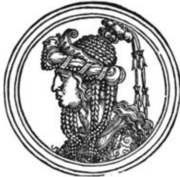
Роксолана. Ханс Зебальд Бехам. 1530 р. Universitätsbibliothek Erlangen-Nürnberg