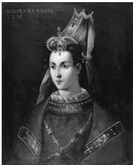
Роксолана. Невідомий художник. Топкарі müzesi