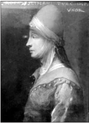
Роксолана. Невідомий автор. Kunsthistorische Museum (Відень)

блакитноока, білолиця українка, яку султан за її життєрадісний характер назвав Хюррем 17 , що з фарсі перекладається як радісна, весела, усміхнена, задоволена, свіжа, яскрава 18 . Про це свідчать рапорти венеційського посла П'єтро Брагадіно, котрий 1526 року писав, що султан не звертав на Махідевран уваги, а спілкувався лише з Хюррем, яка була не стільки красивою, скільки витонченою та мініатюрною 19 .