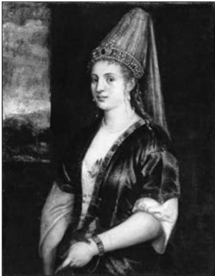
Роксолана. В. Тіціан. 1550-х рр. Ringling Museum of Art. Сарасота. США