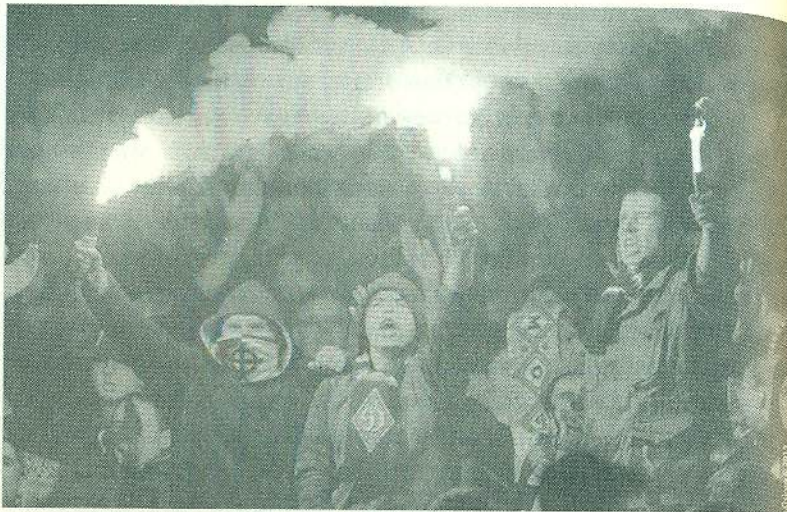
Ультрас «Динамо» (Київ), матч проти «Шахтаря» (Донецьк), 2015 рік

Контрактовій площі та в занедбаному Зеленому театрі збиралися різноманітні «неформали»: панки, скінхеди, репери, готи тощо. Давалося взнаки звільнення людей від гендерних обмежень. Строгі норми пом'якшилися, і у традиційно чоловічі товариства допускалися дівчата. Ці субкультури намагалися вирізнятися ще більшою мірою, ніж гопники та ультраси: творили зрозумілий лише для них сленг, носили «правильний прикид», татуйовання та зачіски, слухали визначену музику. Субкультури співіснували здебільшого мирно, а джерелом їхніх пригод було вживання алкоголю чи наркотиків. Проте скінхеди могли побити якогось хіпана чи репера просто за «неправильний» одяг чи довге волосся.