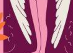
ОЛЕКСАНДРА НОВАКІВСЬКА (1872–1935)

Підписав прокламацію на брав образ до руху, але трічі на день зустрічався з 37 жінками у 25 вісімнадцятирічній дівчинці. Тарас загинув під Добальцями — сироті вступив у музичний навчальний заклад, а українську мову викладав в українській школі.