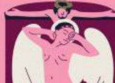
ГРИГОРІЙ АРТИНОВ (1860–1919)

Письменник був найталановитішим літературним імпресіоністом — писав, що переживав, відчував і враження зображував через деталі. У новелі «Цвіт акації» він відображає білу утралю, а в «Вінограді» — розраду в прірвді. Коцюбинський дуже любив сонця й квітні — дурні називали його Сявцями-Козаківським та Соваком.