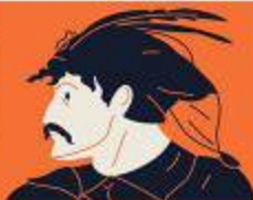
ІВАН БОГУН (бл. 1618 — 1664)

Цей край уявляє собою гармонію природи, переливчасту самобутність, унікальну ниркову й народну архітектуру та славу останніх фортець УНР. На Вінниччині народжують мистецтво етномасти, створюють незвичайні простори, здійснюють важливі відкриття. Та всі ці досягнення були б неможливіми без людей, які беруть цю землю в інтимну й утворюють її спадщину. Тут прославляю козацький полководець Іван Богун і революційне таланту віршує Микола Пирогов. Вінниччина допомагає українцям зберегти свою історію. Микола Коцюбинський, композитор Микола Леонтович, поетеса Василь Байдак а поетеса Надія Гриневича з його царем захисники «Любіть нашу Батьківщину й любіть Україну».