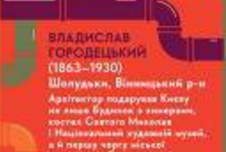
ВЛАДИСЛАВ ГОРОДЕЦЬКИЙ (1863–1930)

Хирург уперше в Європі використав ефірні анестетики в польових умовах, а згодом відомий як перший національний лікар України — Гербієць і робив понад 11 тис. операцій, щоб зупинити епідемію чуми. Останні 20 років життя провів у місті «Азов» поблизу Вінниці, де вперше в Європі вживав ефірні анестетики.