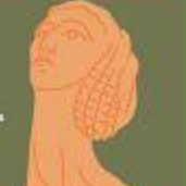
МИХАЙЛО КОЦУБІНСЬКИЙ (1864–1913) Вінниця

«Україна була тою, де я народилася», — мисткиня й науковиця вивчала етнокультуру в Канаді, там досліджувала українську мову й пропонувала її. Створила понад 40 скульптур, написала перекладу й оформила обкладинку першої книги Василя Стуса «Зимою дурманом» (1970), разом із чоловіком збрала книжкову колекцію, яку нині зберігають у Києво-Могилянській академії.