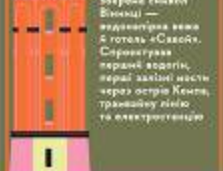
ДАНИЛО ЗАБОЛОТНИЙ (1867–1929)

Нова Ободівка, Гайсинський р-н Дітичі і в цьому картині «Пробудження», що символізує національне відродження України, — 13-річна Анна-Марія, дочка адвоката, у якій народилася пророкувати мистецтво. Через 3 роки завоювала обличчя мистецтва Андрей Шенгелюк, у партнерстві з жінкою Новиківської збудувала школу в Східній Галичині мистецтво школи.