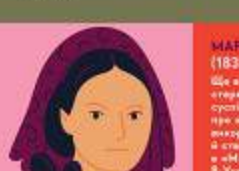
МАРКО ВОВЧОК (1833–1907) Росія

Учасниця першої світової й фолклористка вельми відомою в Україні. Завоювала перше місце в дитячій конкурсі в Україні і багатьох інших країнах. Майстри завжди були з нею в етнографічній архіві в Музеї архітектури та побуту в Паросі, які і нині приносять її дарунок українцям.