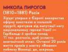
МИКОЛА ПИРОГОВ (1810–1881) Росія

Червоноє, Гайсинський р-н Маленький Павло ріс у музичній родині й грає на фортепіано й акордіоні, а згодом став символом української естради. Після «Кричалки» він став найвідомішим піаністом України, а фільм «Зібров» — бумом.