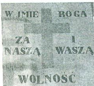
Прапор з написом (польською) «За нашу і вашу свободу»

11. Розгляньте зображення та дайте розгорнуті відповіді на запитання.