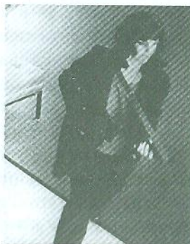
Рис. 1.1. Патті Херст перед символом угруповання «Симбйоністська Визвольна Армія» (ліворуч) і під час пограбування банку «Хібернія» (праворуч), коли Херст начебто примусово перебувала в лавах угруповання

Після арешту в 1975 році була визнана винною і отримала 35 років ув'язнення. Після 22 місяців Патті було звільнено за наполяганням громадськості, а у 2001 році вона була помилувана президентом Біллом Клінтоном.