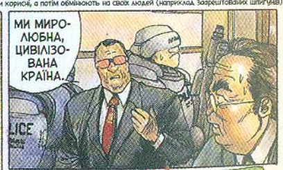
Також, як Іто, тримаєтьч заручниками, поки вони корисні, а потім обміняють на своїх людей (наприклад, зарештованих шпигунів).