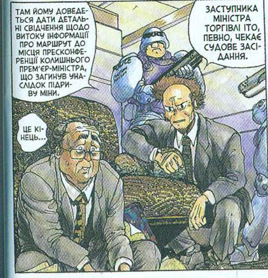
Персона нон грата.

ТАМ ЙОМУ ДОВЕДЕТЬСЯ ДАТИ ДЕТАЛЬНІШІ СВИДЧЕННЯ ШОДО ВИТОКУ ІНФОРМАЦІЇ ПРО МАРШРУТ ДО МІСЦЯ ПРЕСКОНОБРЕННІ КОЛИШНЬОГО ПРЕМ'ЄР-МІНІСТРА, ШО ЗАГИНУВ УНАСЛАДОК ПІАРИВУ МІНІ.