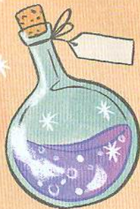
Зачарована морська вода