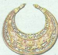
▲ Скифська пектораль з кургану Товста Могила. IV ст. до н. е.