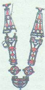
▲ Ланцюг нагрудний. III–IV ст. (київська культура)