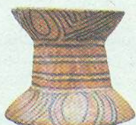
▲ Трипільський посуд. V тис. до н. е.