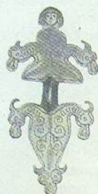
▲ Застібка-фібула з Мартинівського скарбу. VI–VII ст.