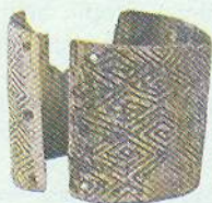
▲ Браслет з бивня мамонта. 20 тис. років тому

Роздивіться ілюстрації. Яких періодів історії стародавнього світу вони стосуються? За якими ознаками ви це визначили? За якою спільною ознакою об'єднано зображені пам'ятки? Що вам відомо про життя на теренах України за найдавніших часів?