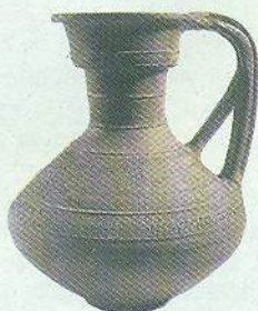
▲ Глечик із сільськогосподарським календарем. IV ст. (черняхівська культура)