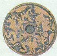
▲ Рибний таріль. Німфей (поблизу сучасної Керчі). IV ст. до н. е.